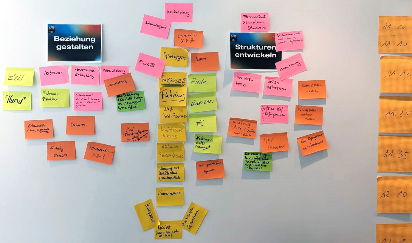
Abb. 1 Post-It-Sammlung aus dem Workshop zum Spannungsfeld Struktur - Beziehung

Beziehungsorientierte Organisation und Anstrengungen in Organisationen abzubilden oder gar zu bewerten, erscheint uns im Sinne der humanistischen Unternehmensführung wertvoll und wertschöpfend. Die verantwortungsvolle und achtsame Führungsaufgabe liegt darin, ein gutes Mass an Struktur und Beziehung zu gestalten. Bereits aus den in 75 Minuten gesammelten Impulsen (Abb. 1) der Workshop-teilnehmer:innen liesse sich ein Buch verfassen. 17